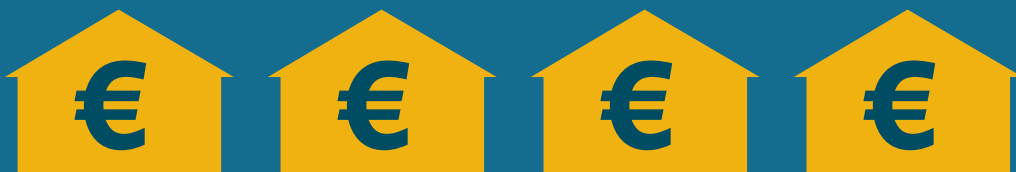
Servicii + rețele digitale